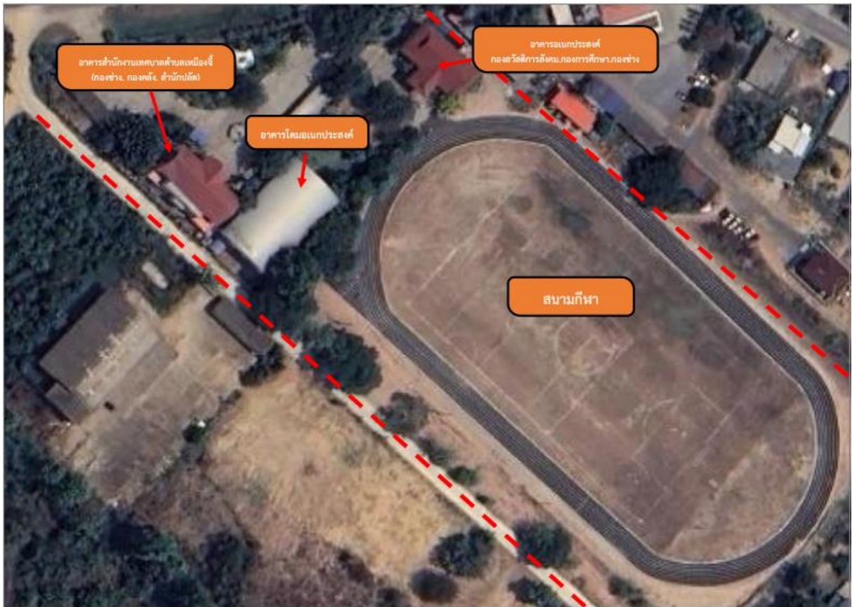
รูปที่ 2 แผนผังแสดงขอบเขตเทศบาล